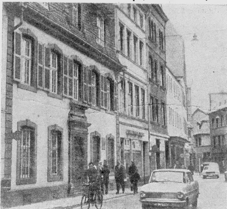
Дом номер 10 (крайний слева) по улице Брюккенштрассе в старинном немецком городе Трире, где 5 мая 1818 года родился Карл Маркс.